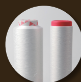
PA11 yarn 100%