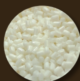
PA11 chip 100%